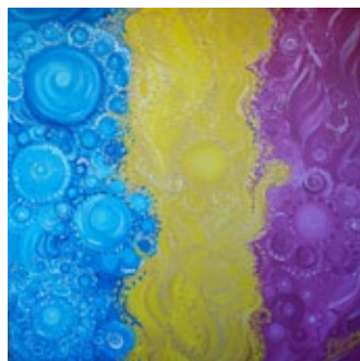
Llama Trina Divina Acrílico sobre tela - 100x100 cm. 2011 Precio: 1.900€